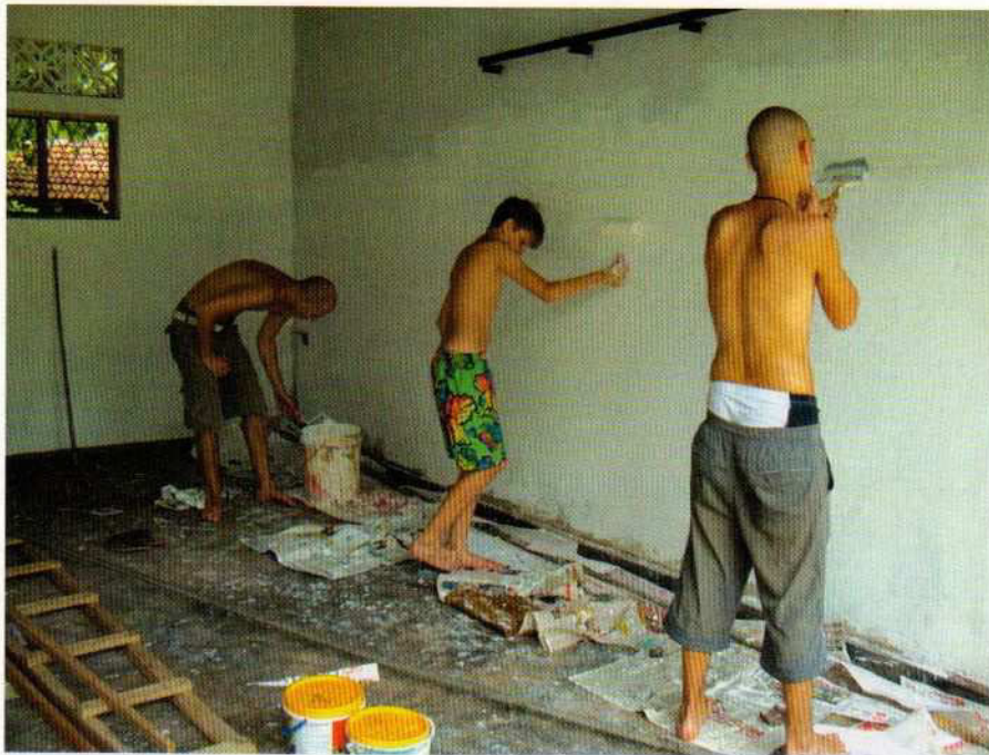
A pesti srácok minden napjukat munkával kezdték